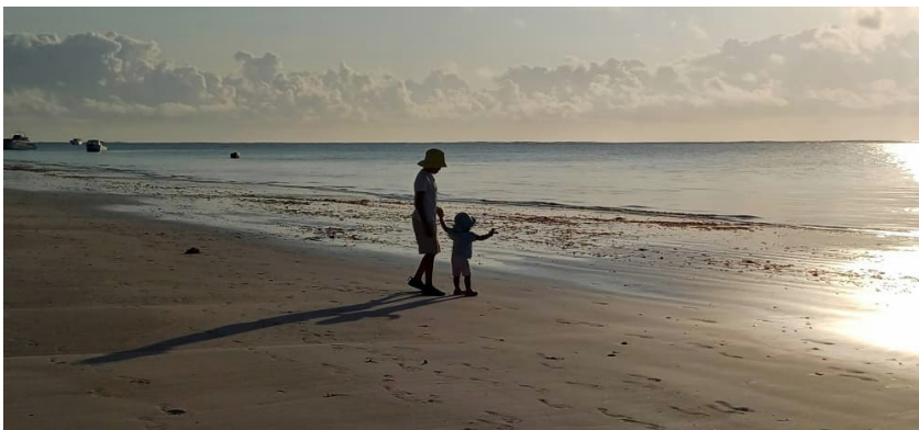
Diani beach, Mombasa

Onneksi saimme sadekauden keskellä perheen kanssa hetken hengähtää Mombasan lämmössä – se on helppo ja mukava kohde pienten lasten kanssa. Addiksesta sinne lentää vain kaksi tuntia, joten lyhytkin viikonloppuloma onnistuu. Toisaalta matkustusmahdollisuuksia rajoittavat todella korkeat Afrikan sisäiset lentohinnat, joten matkat tuntuvat erityisen hyviltä, kun niille pääsee. Myös kesä Suomessa oli meille ilon ja rauhan aikaa. Vietimme aikaa perheen ja ystävien kanssa, ja mökkeilimme Lähetyseuran vuokramökillä – lapsille se oli ainutlaatuinen kokemus, ja uinnit jatkuivat pitkälle valoisaan yöhön.