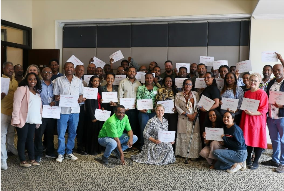
Vammaisinkluusio ja sukupuolten tasa-arvo työpaja.

Viikko huipentui yhteiseen ilmastohankkeidemme suunnitteluun tulevalle kaudelle 2026 alkaen. Oli arvokasta pysähtyä, arvioida viime hankekautta, jakaa kokemuksia ja oppia toisiltamme. Toivomme, että alueellinen yhteistyö hankkeiden välillä vahvistuu entisestään. Kumppanit kiittelivät mahdollisuudesta kokoontua ja oppia. Tämä yhteinen suunta on juuri se, jonka myös itse toivoisin Etiopian työssämme lisääntyvän ja tämän eteen pyrin työskentelemään jatkossakin.