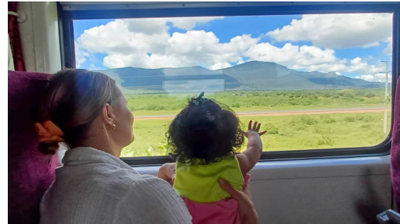
Matkalla Keniassa, Lähetysseuran työntekijäpäivillä huhtikuussa 2025.

Kirjoitin jo kertaalleen valmiiksi uutiskirjeen, jossa kerroin Etiopian tämänhetkisen turvallisuustilanteen säilyneen samana ja että Etiopiassa ”no news, is good news”. Valitettavasti pian tämän jälkeen jännitteet eri puolilla maata alkoivat kasvaa. Seuraamme erityisellä huolella Tigrayn tilannetta, jossa viimeisin konflikti päättyi vain muutama vuosi sitten. Myös Amharan alueella aseelliset yhteenotot jatkuvat, ja etelässä Gambellaa saapuu yhä enemmän pakolaisia Etelä-Sudanista. Nämä alueet ovat tärkeitä myös työni kannalta: