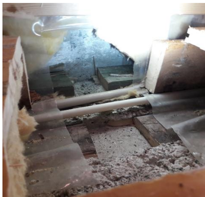
Kuva: Alapohja ja perusrakennetta. Betonivaluun on asennettu tartuntalauta.

Alapohjarakenteena takkatuvan ja keittiön osalla on reuna-alueella alapuolelta lämmöneristetty (styrox eriste, vahvuus ei tiedossa) betonilaatta, jonka vahvuus on n. 300 mm, keskialueilla on 300 mm vahva betonilaatta (betonilaatan alla ei ole eristettä). Betonilaatan päällä on villalämmöneriste ja niskat ja lankkulattia. Muualla tiloissa alapohjarakenteena on n. 400 mm vahva betonilaatta.